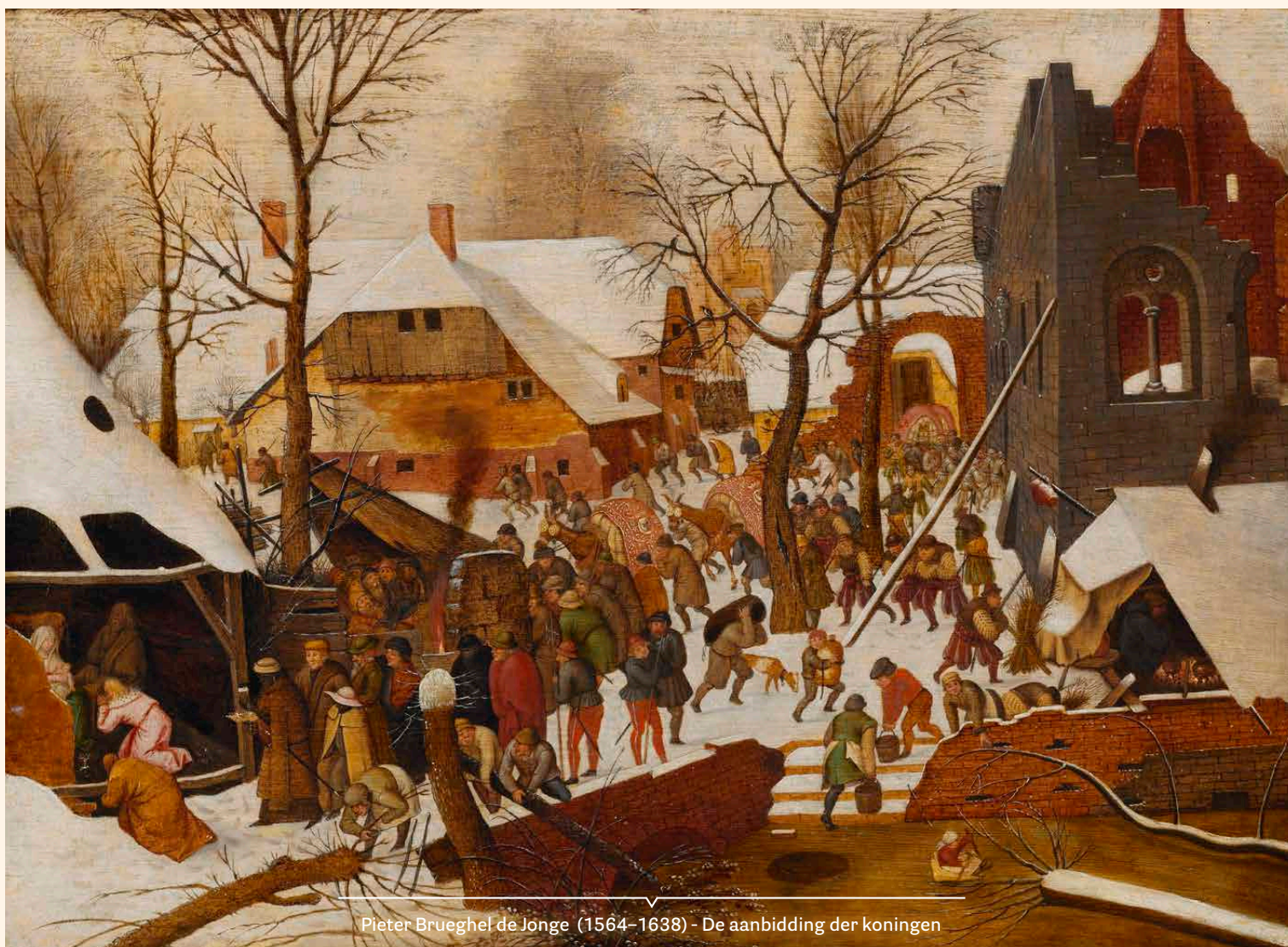
Pieter Bruegel de Jonge (1564–1638) - De aanbidding der koningen