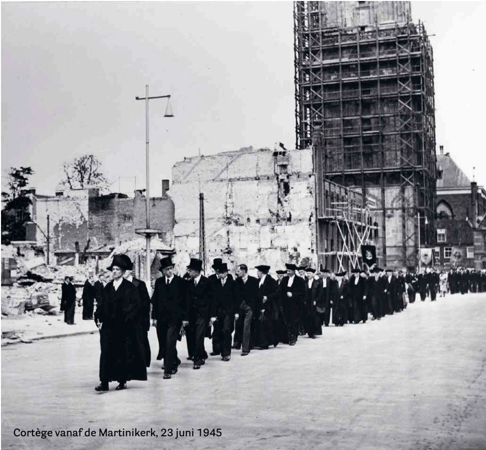
Cortège vanaf de Martinikerk, 23 juni 1945

Halverwege de negentiende eeuw hing het voortbestaan van de universiteit al aan een zijden draadje, ook in 1906, na de brand van het Academiegebouw, dreigde Den Haag haar op te doeken en in de jaren dertig kwamen er vanuit het ministerie van Onderwijs voorstellen om een paar van de Groningse faculteiten te sluiten. Dan mag het tien keer oorlog zijn, het diepe besef dat de universiteit te allen tijde moet vechten voor haar voortbestaan bleef volop werkzaam.