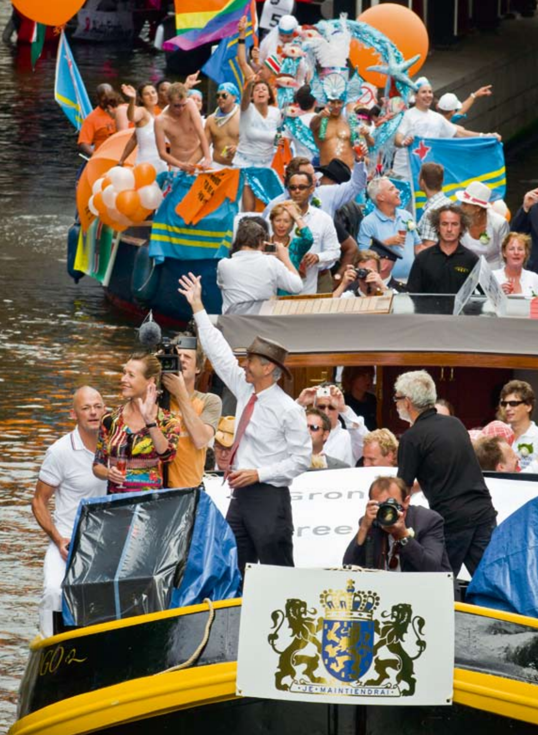
Canal Parade 2008

Abdolah een bestseller is, dat er in Amsterdam een poldermoskee staat waar mannen en vrouwen samen bidden, dat vrijwel elke Nederlander weet wat het Suikerfeest en de ramadan zijn en dat we ons bezoek niet meer automatisch de deur uitzetten als om zes uur de aardappels op tafel komen – het zijn allemaal positieve signalen, meent hij.